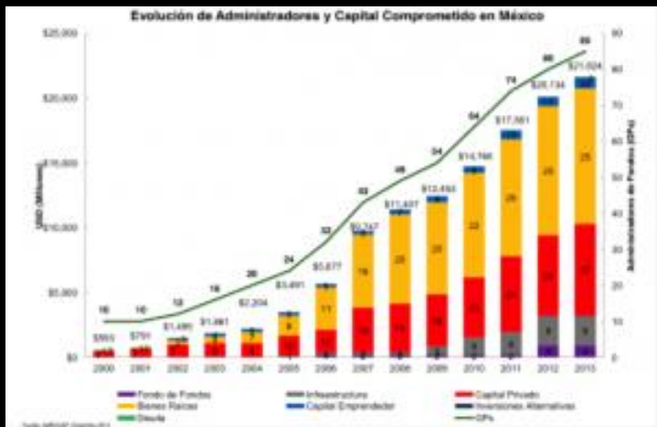
Vehículos de inversión y volumen de capital privado